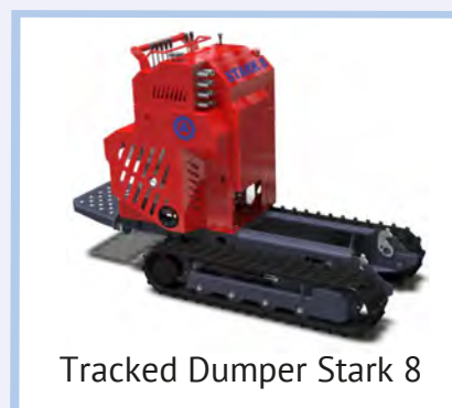
Tracked Dumper Stark 8