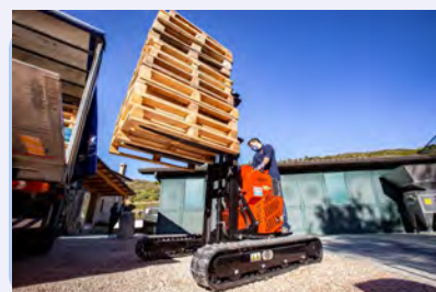
логистика и склад