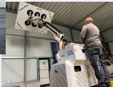
промышленность и производство