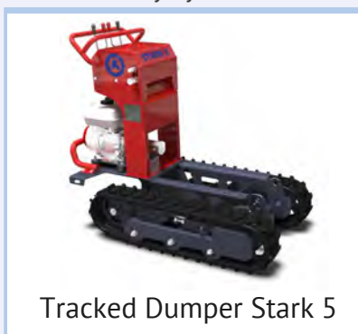
Tracked Dumper Stark 5

Многофункциональный гусеничный думпер (самосвал). Две каретки разной ширины, газовые двигатели, больше места для груза весом до 800 кг., возможность конфигурирования, затраты на управление сведены к минимуму.