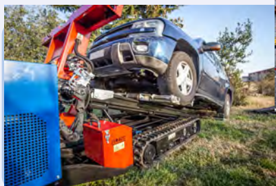
перемещение автомобилей и транспортных средств